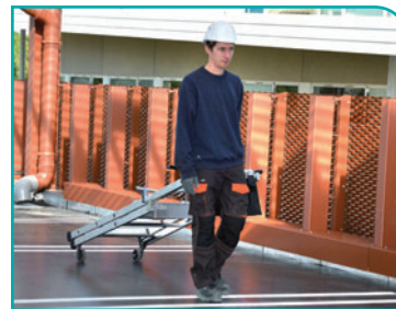
Très maniable et facile à déplacer sur le chantier.