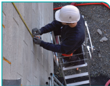
Protection de l'opérateur par garde-corps et chaînettes.