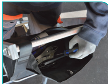
Sac porte-outils très résistant et de grande capacité 15 Kg.